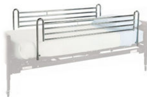
Barandales de protección